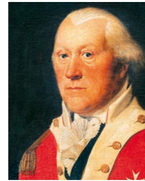
Friedrich Eberhard von Rochow 1734–1805

Auf dem ersten Grundsatz beruhen alle Aussagen der Reckahner Reflexionen und alle sind wechselseitig aufeinander bezogen. Die 10 Leitlinien sind aus Beobachtungen im pädagogischen Alltag hervorgegangen, es geht ihnen also um die Stärkung von Formen der Anerkennung, die im Schul- und Kitaleben vorzufinden sind und in einem kollektiv geteilten menschenrechtlich-demokratischen Verständnis von pädagogischer Anerkennung verankert sind. Die Aussagen des ersten Teils unter der Überschrift „Was ethisch begründet ist“ wurden aus im Feld praktizierten gelingenden pädagogischen Handlungsweisen abgeleitet. Die Aussagen des zweiten Teils „Was ethisch unzulässig ist“ sind Reaktionen auf im Feld praktizierte problematische pädagogische Handlungsweisen. Auch die Vorschläge für „Handlungsebenen der Stärkung pädagogischer Ethik“ sind Anregungen, die allesamt in Praxisfeldern gefunden wurden.