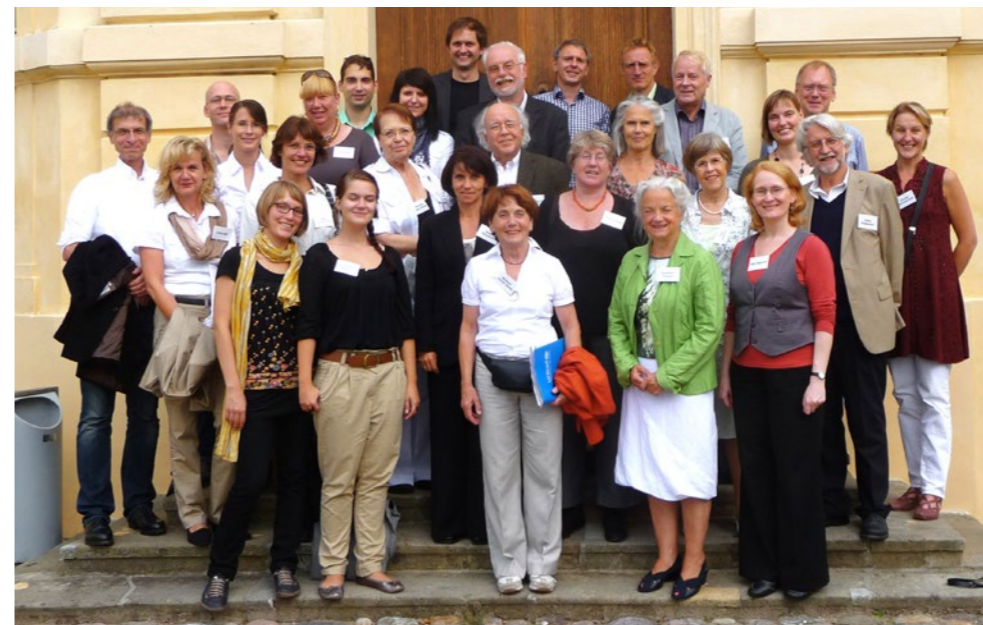
Gründungskonferenz des Arbeitskreises Menschenrechtsbildung im Rochow-Museum Reckahn im Jahr 2011

„Es kommt auf den ersten Empfang der Kinder an. Er muss vorzüglich freundlich und liebevoll sein, damit sie Zutrauen fassen können“ – mit diesen Worten fasste ein zeitgenössischer pädagogischer Augenzeuge seine in der Musterschule gewonnenen Erkenntnisse zur pädagogischen Beziehung zusammen. Er hatte den dortigen Unterricht über ein