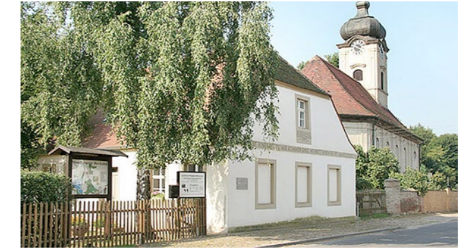
Philanthropische Musterschule Reckahn von 1773, heute Schulmuseum